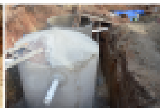
3) Terminación de los tanques sépticos