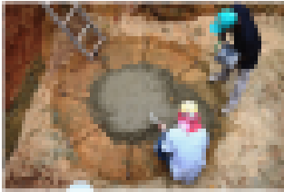
1) Construcción base de los tanques sépticos