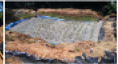
4) Funcionamiento de la planta