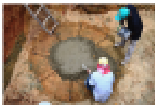
1) Construcción base de los tanques sépticos