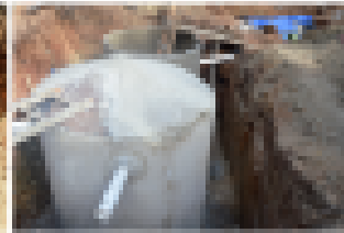
3) Terminación de los tanques sépticos