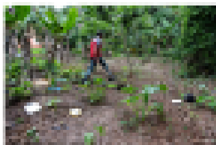
1) Visita del terreno