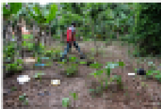
1) Visita del terreno