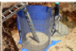
2) Construcción de tanques sépticos