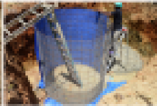
2) Construcción de tanques sépticos