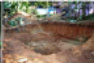
2) Trabajos de excavación