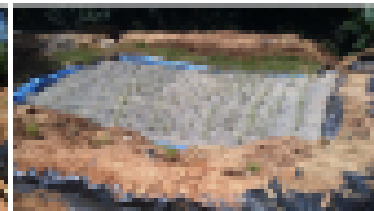
4) Funcionamiento de la planta